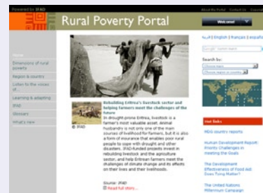
United Nation's IFAD