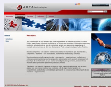
Jota Technologies & Consulting